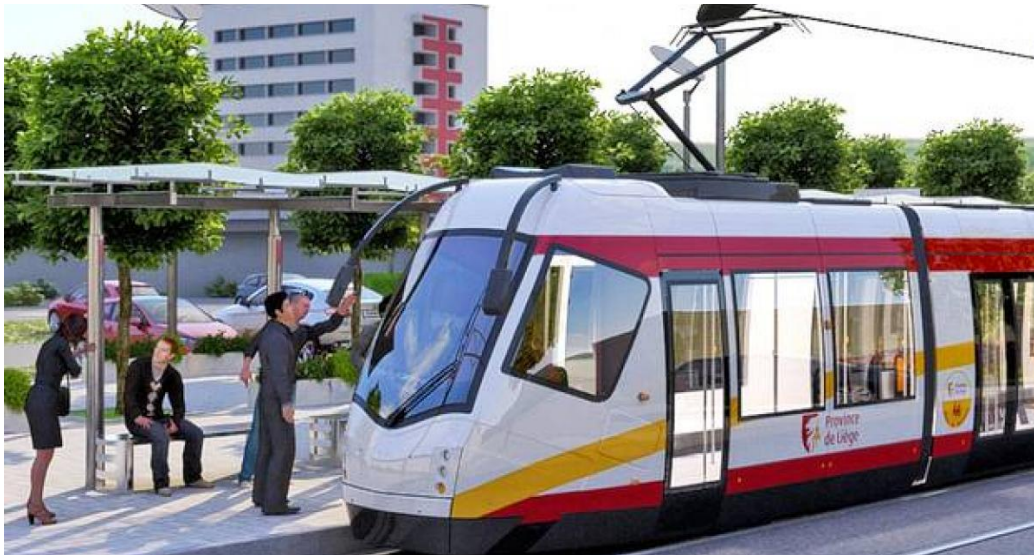
Image de synthèse