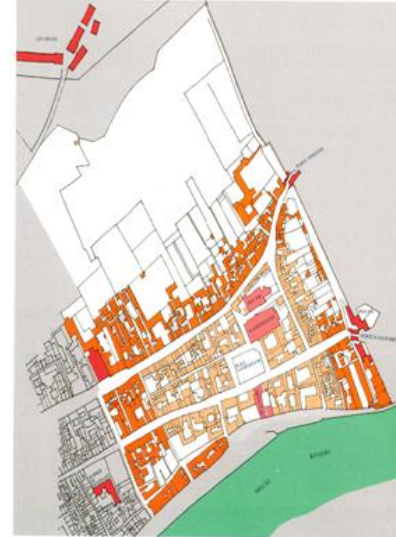
TERRITOIRE de la COLLEGIALE