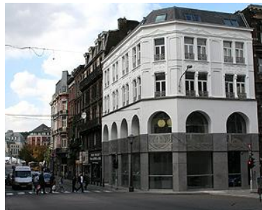
Maison de l'Habitat

Arcanes administratives – facilitateur ? En notre quartier, il y a beaucoup de petits logements, souvent occupés par des personnes fragilisées. M.Y. : Le souci est de fixer des règles minimales. L'ensemble de cette problématique est une préoccupation de la Ville. Elle ne souhaite pas recréer de nouveaux logements, mais avant tout veiller à ce qu'ils soient salubres et décents. Un encadrement peut-être obtenu. (Ville, R.W., ..)