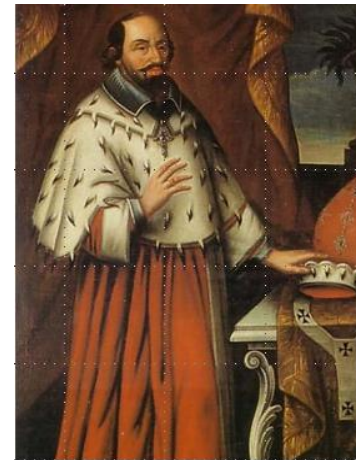
Ferdinand de Bavière